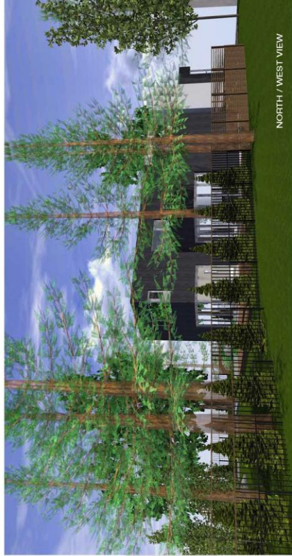
NORTH / WEST VIEW