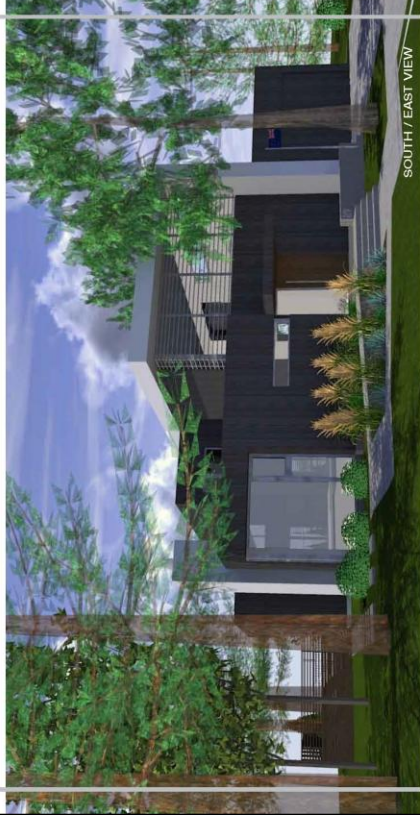
SOUTH / EAST VIEW