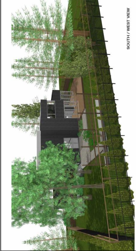
SOUTH / WEST VIEW