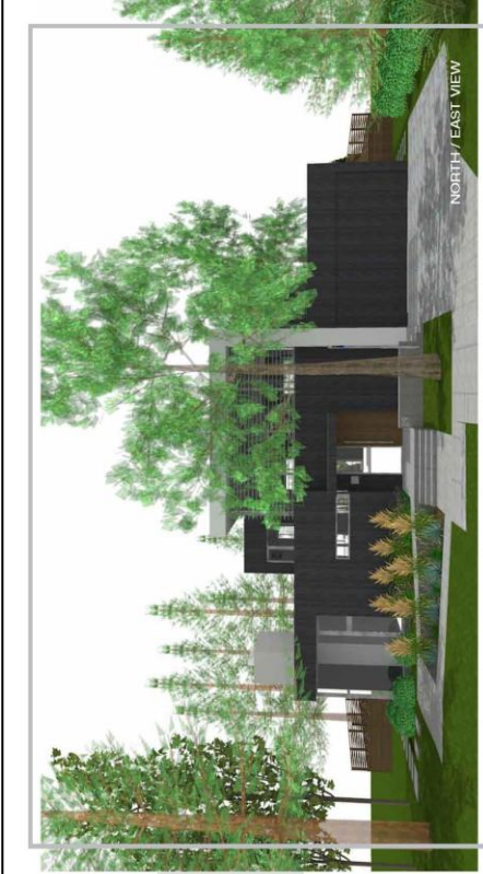
NORTH / EAST VIEW